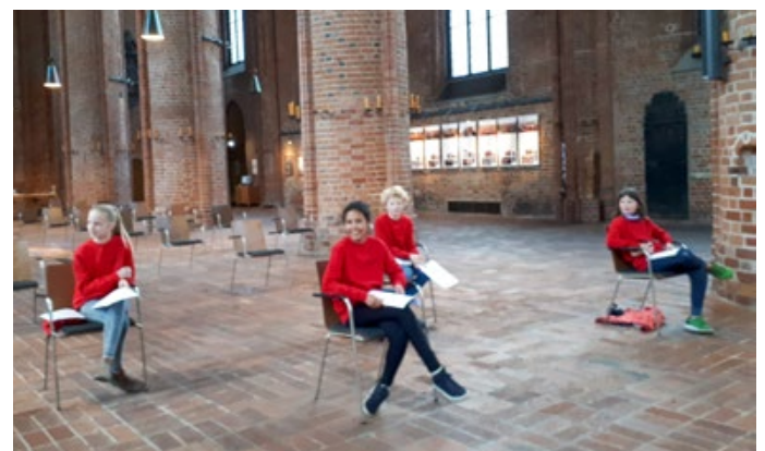
Probe in der Marktkirche