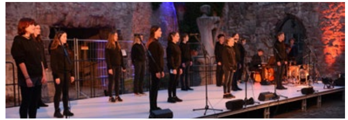
Konzert vom Jugendchor II in der Aegidienkirche