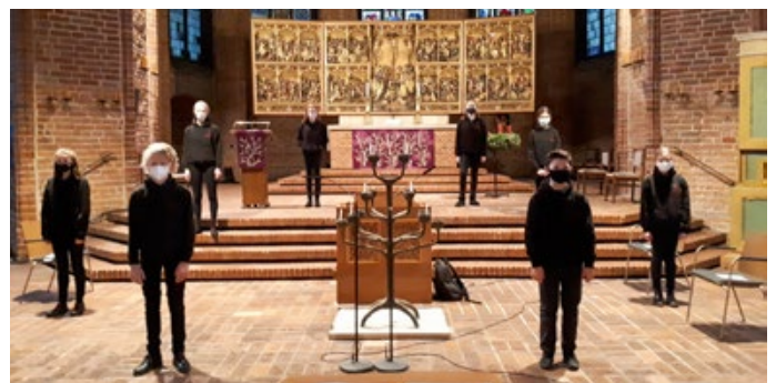
Gottesdienst mit dem Jugendchor I

18 Gottesdienste und Vespere wurden von kleinen, feinen und sehr gut vorbereiteten Ensembles aus dem KiChor II, JuChor I und JuChor II gestaltet! Darunter waren zwei TV-Gottesdienste. Ein ganz besonderer Höhepunkt war das Video-Krippenspiel, eingebettet in eine Christvesper, das der Kinderchor II und die Chorwachtel aufgenommen haben und das noch immer auf unserer Website zur Verfügung steht.