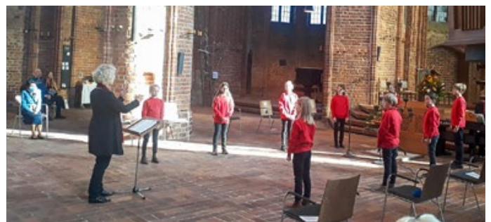
Gottesdienst mit dem Kinderchor II