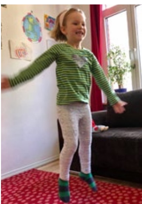
Videoprobe der Chorwachtel