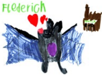
Gemalt von Charlotte aus dem Kinderchor I

Diese Chance hätten wir ohne Corona wohl nicht gehabt. Leider blieb der Kinderchor I außen vor, denn die Beschränkungen waren streng. Dafür haben sie eine Fledermaus-Patenschaft für die hilflose kleine Fledermaus übernommen, die im Oktober kraftlos an der Marktkirchenmauer neben dem Portal hing. Sie ist jetzt in guter Pflege im Fledermauszentrum vom BUND und hat vom Chor den Namen „Flederich“ bekommen.